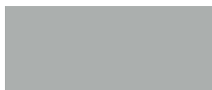
Gris lumineux 222